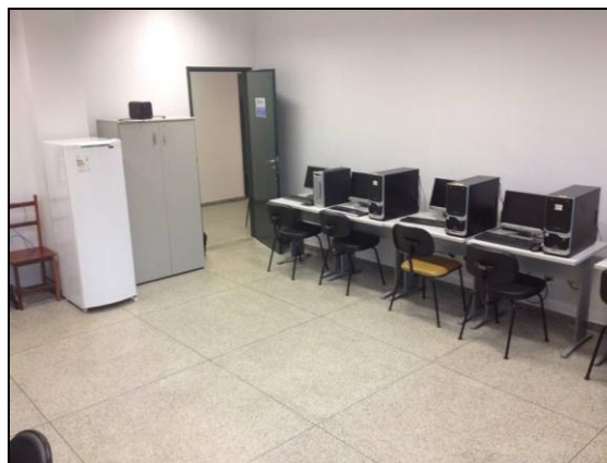
Figura 2: Sala de Estudos e Pesquisas.