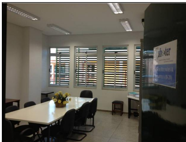
Figura 3: Sala de Reuniões.