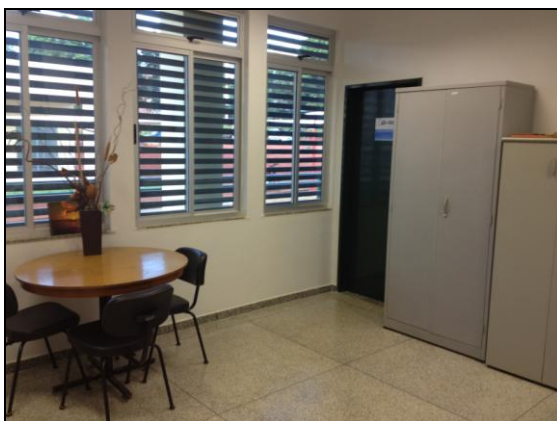
Figura 1: Sala da coordenação.